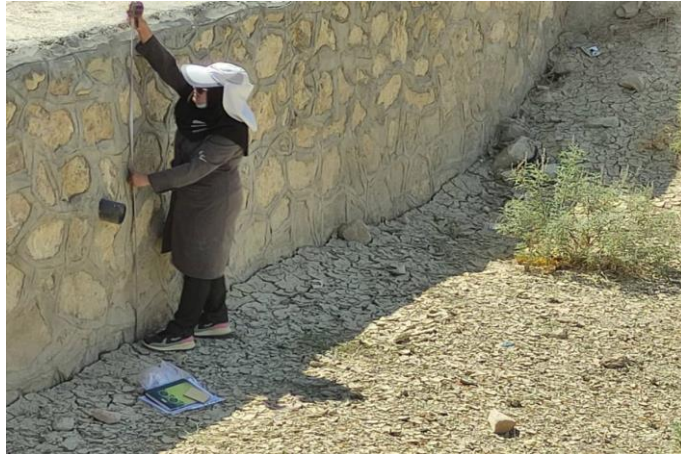
شکل ۳- اندازه‌گیری ارتفاع رسوبات ته‌نشین شده پشت بند اصلاحی Fig. 3. Measurement of the height of the deposited sediments behind the check dam

رواناب در مخزن بند است (Verstraeten and Poesen, 2000).